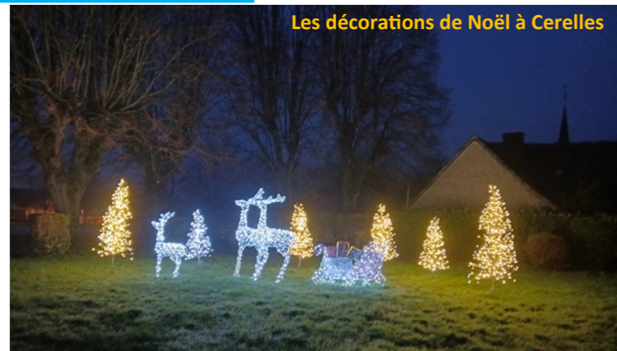
Les décorations de Noël à Cerelles

CE QUI NOUS LIE Pièce chorégraphique « Compagnie Gong » 17/01/2025—20 H 30 (du 13 au 17/01 pour résidence)