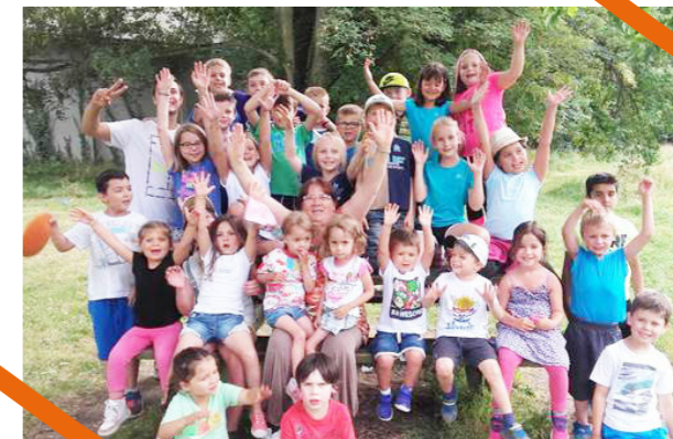
Construction de fusées à air et à eau, de petits bateaux, de voitures à propulsion, cabanes, jeux d'eau, atelier cuisine, animation cirque, étaient au programme !

Renseignements & inscription 06 85 11 33 15 ericpoudelet@hotmail.com Inscription jusqu'au 15 septembre.